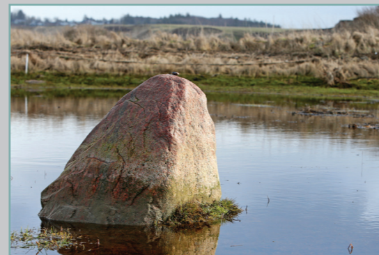
Sten med jernnagle til tøjring af heste