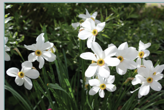
Møllekonens pinseliljer ses på marken