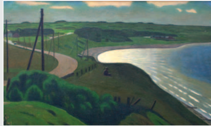
"Udsigt mod Å-mølle" malet af Niels Bjerre 1931. Maleriet hænger på Lemvig Bibliotek.