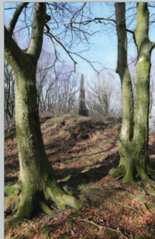
Frihedsstøtten fra 1902 på en høj i skoven

Den lille skov, der ses mellem landevejen og sommehusene ved Jeppe's Led, blev plantet i 1887, da man fejrede 100 året for stavnsbåndets ophævelse (de danske bønders frigørelse). Der blev startet en indsamling, og i 1902 blev der på en høj i skoven rejst en minimodel af frihedsstøtten. Den står i skoven endnu.